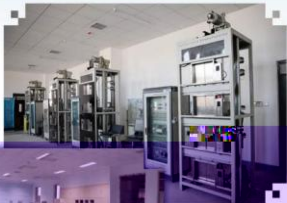
智能电梯安装调试维护训练场所