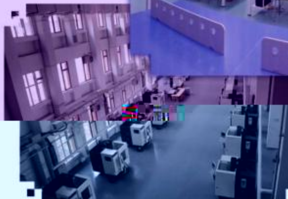
DMG 数控技术训练场所